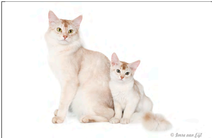
(Jack met zijn zoon)